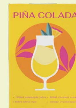
4. GESCHIRRTÜCHER je 6,95