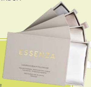
3. SEIDEN-SCHLAFMASKE 29,95 IN EDLER GESCHENKBOX ESSENZA