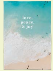
4. REISEKISSEN 59,95 statt 69,95