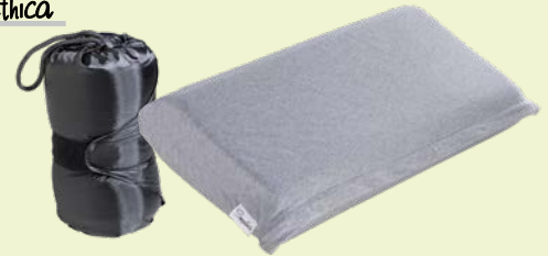
5. REISETOPPER 99,95 statt 149,-