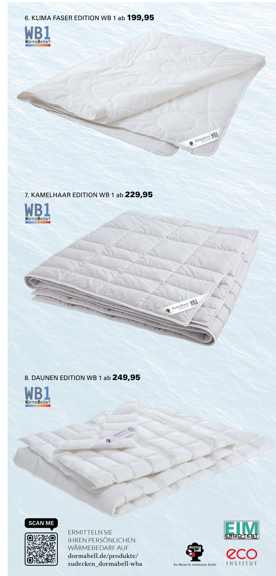
6. KLIMA FASER EDITION WB 1 ab 199,95

6. KLIMA FASER EDITION WB 1: Das Ultraleichtgewicht unter den Zudecken mit kühlender Wirkung. Sie eignet sich ideal als Sommerbett oder für besonders hitzeempfindliche Menschen. Die superleichten Funktions-Klimafasern (aus 100 % recyceltem, biologisch abbaubarem Polyester) und die körperbetonte Steppung sorgen für einen äußerst angenehmen Komfort und ein trockenes Schlafklima. Waschbar bis 60 °C. 135 / 200 cm 199,95, 155 / 220 cm 319,95. 7. KAMELHAAR EDITION WB 1: Dieser Hauch von Zudecke und ihre natürlich klimatisierende Wirkung werden Sie begeistern. So genießen Sie einen optimalen Wohlfühlkomfort und erholsamen Schlaf. Das edle Kamelhaar wirkt antistatisch und temperatursausgleichend. 135 / 200 cm 229,95, 155 / 220 cm 329,95. 8. DAUNEN EDITION WB 1: Endlich kein Schwitzen mehr. Luftig-leicht, wohltuendes Klima auch in heißen Nächten. Das Sommerbett der Superlative bei dormabell. Gefüllt mit weißen Gänsedaunen (100 % Daunen). Waschbar bis 60 °C. 135 / 200 cm 249,95, 155 / 220 cm 349,95. 9. LEINEN EDITION WB 1: Kühlendes Leinen, veredelt mit feiner Bio-Baumwolle. Für besonders hitzesensible Menschen. Ein ideales Sommerbett, möglich durch eine neue Vliestechnik. Besonders anschmiegsam durch körpergerechte Steppung und super-leichte Leinenfüllung. Waschbar bis 60 °C. 135 / 200 cm 129,95, 155 / 220 cm 199,95.