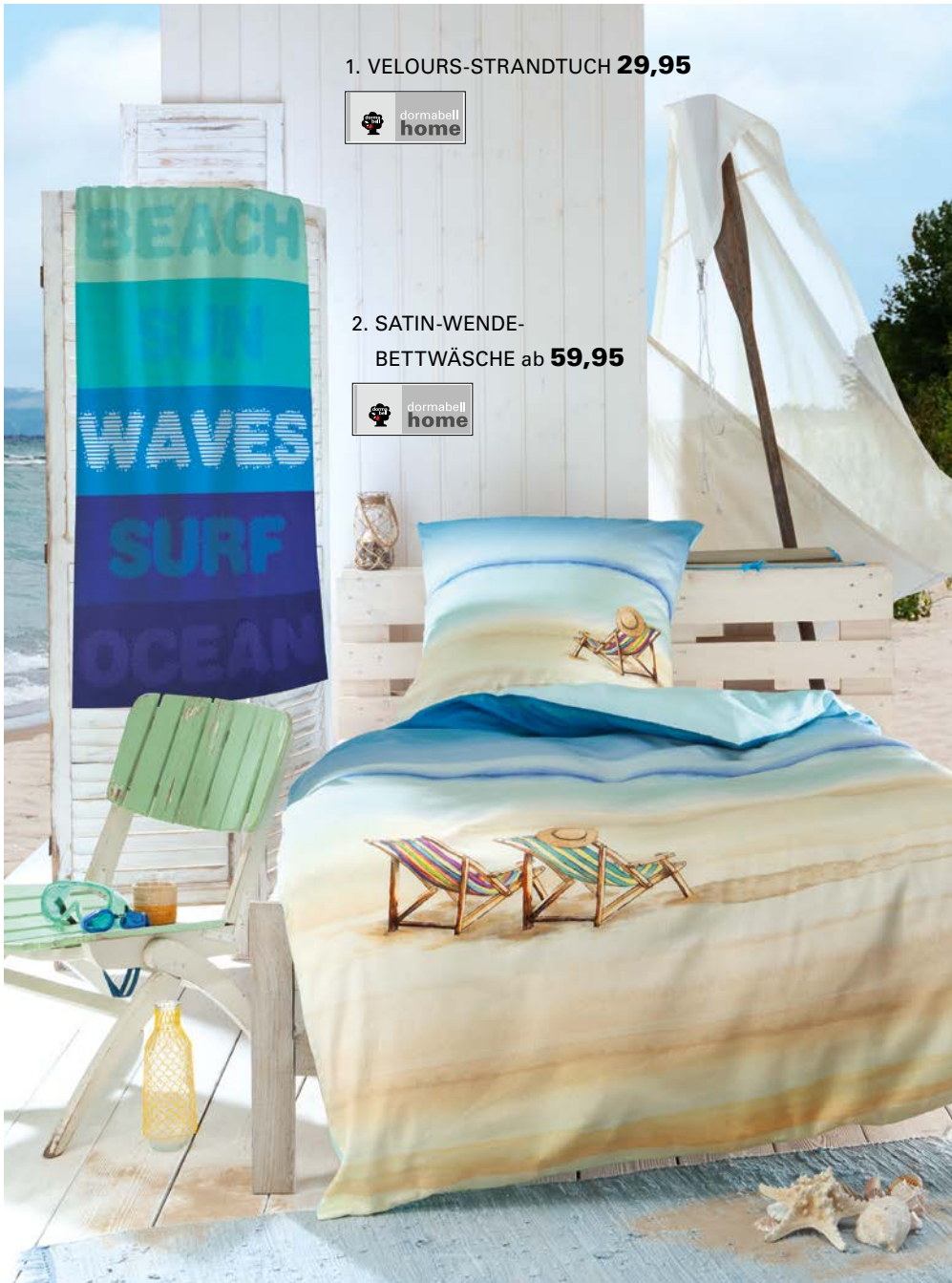
1. VELOURS-STRANDTUCH 29,95