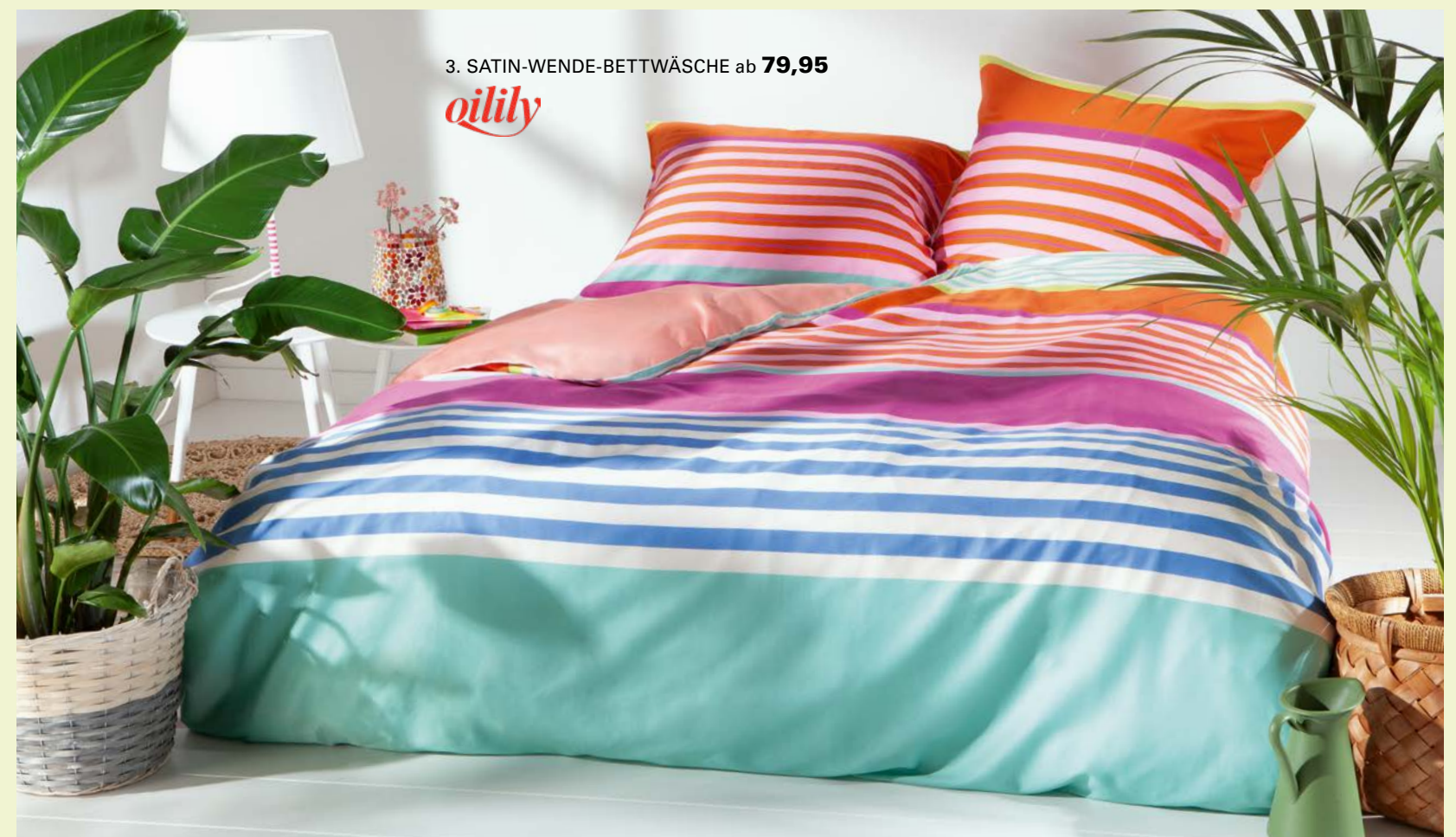
3. SATIN-WENDE-BETTWÄSCHE ab 79,95