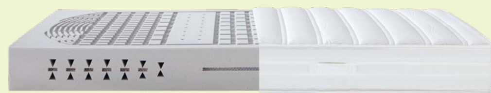
3. MATRATZE DORMABELL INNOVA AIR S 18 – BEZUG SILVER CLEAN 1.199,-