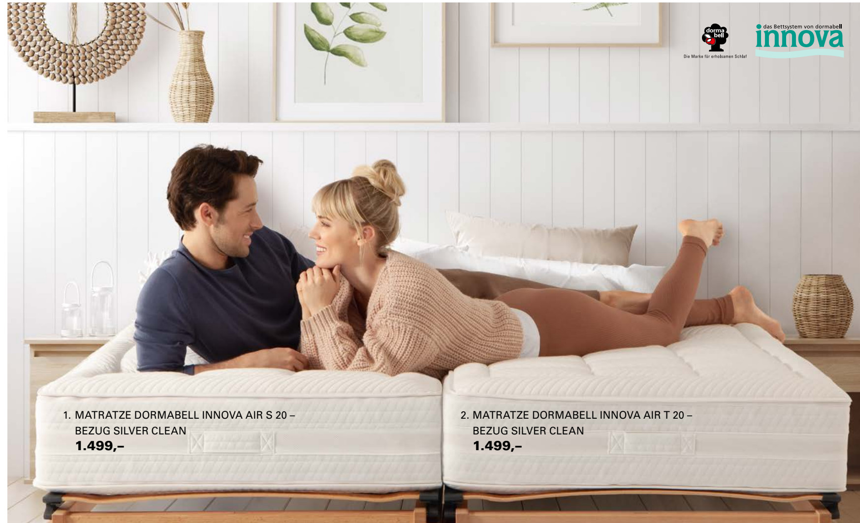
1. MATRATZE DORMABELL INNOVA AIR S 20 – BEZUG SILVER CLEAN 1.499,-

Matratze ist ein Bett nur halb so bequem. Der Körper sollte sanft einsinken können, aber auch ideal gestützt und getragen werden. Für individuellen Wohlfühlkomfort sind Matratzen von dormabell Innova in mindestens drei Festigkeitsstufen mit verschiedenen Bezügen und optional mit Topper erhältlich.