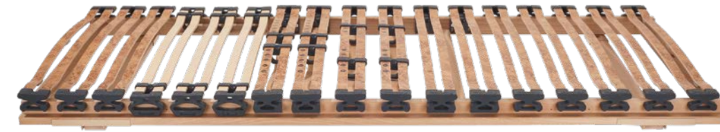
5. RAHMEN DORMABELL INNOVA N 649,-

1. MATRATZE DORMABELL INNOVA AIR S 20 – BEZUG SILVER CLEAN: Für hervorragenden Komfort. MTS biosyn®, ein Schaum auf natürlicher Basis, sorgt für hohe Oberflächenelastizität und Druckentlastung bei ergonomisch optimaler Stützkraft. Preisbeispiel: 90 / 200 cm, 100 / 200 cm, medium, 1.499,-. 2. MATRATZE DORMABELL INNOVA AIR T 20 – BEZUG SILVER CLEAN: In Optik, Höhe und Funktion identisch mit der dormabell Innova Air S 20. Der entscheidende Unterschied: Ein sehr punktelastischer, anschmiegsamer Tonnen-Taschenfederkern sorgt für die perfekte Körperanpassung, gibt sanft nach oder stützt dynamisch ab. Preisbeispiel: 90 / 200 cm, 100 / 200 cm, medium, 1.499,-. 3. MATRATZE DORMABELL INNOVA AIR S 18 – BEZUG SILVER CLEAN: Liegekomfort der besonderen Klasse verbunden mit sehr guten ergonomischen und klimatischen Eigenschaften. Ideal für Schläfer, die eine anschmiegsame Matratzenoberfläche bevorzugen. Auch für Gewichtsklassen bis ca. 140 kg zu empfehlen. Preisbeispiel: 90 / 200 cm, 100 / 200 cm, medium, 1.199,-. 4. MATRATZE DORMABELL INNOVA AIR T 18 – BEZUG SILVER CLEAN: Die sehr guten Liegeeigenschaften des Tonnen-Taschenfederkerns werden durch die Feinzonierung der Polsterung mit dem Schaum MTS biosyn® unterstützt. Mit innovativer Belüftungstechnik für ein ausgeglichenes Schlafklima. Preisbeispiel: 90 / 200 cm, 100 / 200 cm, medium, 1.199,-.