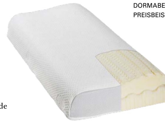
7. NACKENSTÜTZKISSEN DORMABELL CERVICAL PREISBEISPIEL: NB 4 139,95

WELCHES CERVICAL KISSEN ZU IHNEN PASST, ZEIGT DER KISSENBERATER AUF dormabell-cervical.de