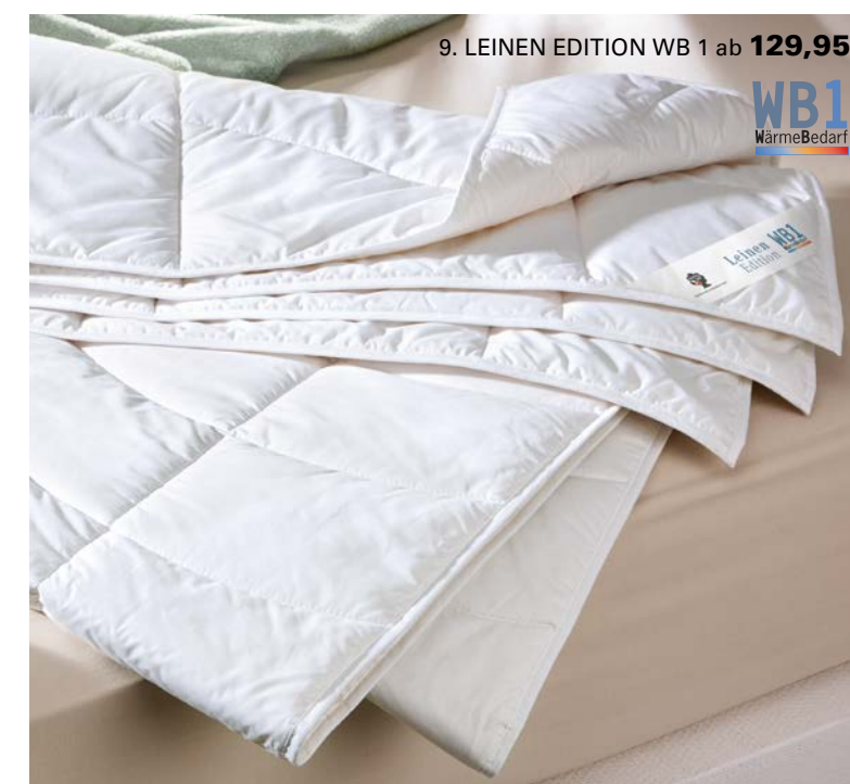
9. LEINEN EDITION WB 1 ab 129,95

6. KLIMA FASER EDITION WB 1: Das Ultraleichtgewicht unter den Zudecken mit kühlender Wirkung. Sie eignet sich ideal als Sommerbett oder für besonders hitzeempfindliche Menschen. Die superleichten Funktions-Klimafasern (aus 100 % recyceltem, biologisch abbaubarem Polyester) und die körperbetonte Steppung sorgen für einen äußerst angenehmen Komfort und ein trockenes Schlafklima. Waschbar bis 60 °C. 135 / 200 cm 199,95, 155 / 220 cm 319,95. 7. KAMELHAAR EDITION WB 1: Dieser Hauch von Zudecke und ihre natürlich klimatisierende Wirkung werden Sie begeistern. So genießen Sie einen optimalen Wohlfühlkomfort und erholsamen Schlaf. Das edle Kamelhaar wirkt antistatisch und temperatursausgleichend. 135 / 200 cm 229,95, 155 / 220 cm 329,95. 8. DAUNEN EDITION WB 1: Endlich kein Schwitzen mehr. Luftig-leicht, wohltuendes Klima auch in heißen Nächten. Das Sommerbett der Superlative bei dormabell. Gefüllt mit weißen Gänsedaunen (100 % Daunen). Waschbar bis 60 °C. 135 / 200 cm 249,95, 155 / 220 cm 349,95. 9. LEINEN EDITION WB 1: Kühlendes Leinen, veredelt mit feiner Bio-Baumwolle. Für besonders hitzesensible Menschen. Ein ideales Sommerbett, möglich durch eine neue Vliestechnik. Besonders anschmiegsam durch körpergerechte Steppung und super-leichte Leinenfüllung. Waschbar bis 60 °C. 135 / 200 cm 129,95, 155 / 220 cm 199,95.