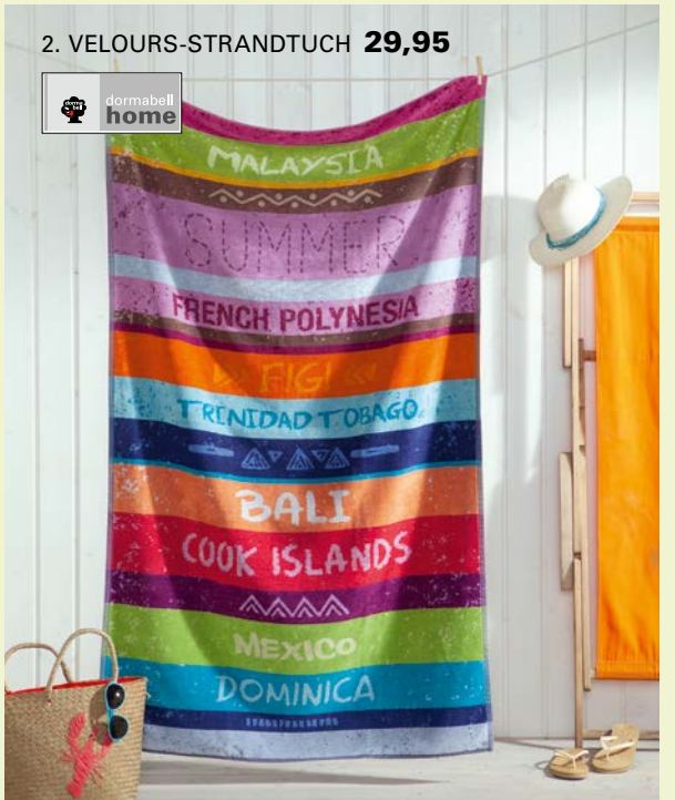
2. VELOURS-STRANDTUCH 29,95