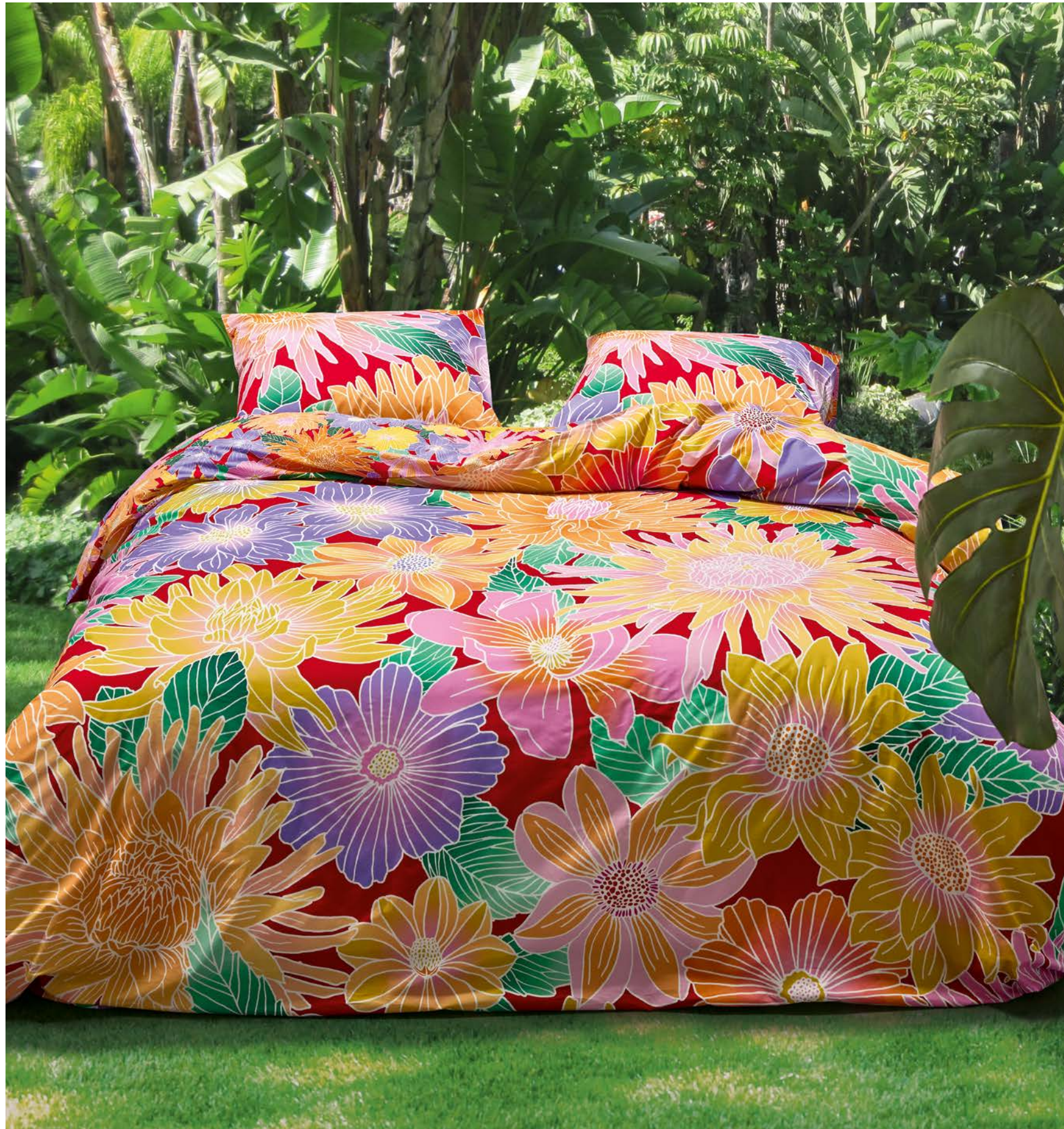
1. PERKAL-WENDE-BETTWÄSCHE ab 69,95 ESSENZA

1. PERKAL-WENDE-BETTWÄSCHE: Eine wunderschöne fantasievolle Blütenpracht zeigt die Vorderseite. Die Rückseite zeigt kleinere Blüten. Alles in leuchtenden, sommerlichen Farben – und das Ganze in herrlich weicher, hochwertiger Perkal-Qualität. Aus diesem Stoff sind traumhaft schöne Sommernächte gemacht. Aus 100 % Baumwolle. Mit Reißverschluss. 135 / 200 cm 69,95, 155 / 220 cm 89,95. 2. VELOURS-STRANDTUCH: Bunt gestreift und hübsch bedruckt mit den schönsten Urlaubsparadiesen – ein Strandtuch, das auffällt und echtes Sommerfeeling verbreitet. Aus 100 % Baumwolle. 100 / 180 cm 29,95.