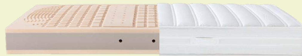
4. MATRATZE DORMABELL INNOVA AIR T 18 – BEZUG SILVER CLEAN 1.199,-

1. MATRATZE DORMABELL INNOVA AIR S 20 – BEZUG SILVER CLEAN: Für hervorragenden Komfort. MTS biosyn®, ein Schaum auf natürlicher Basis, sorgt für hohe Oberflächenelastizität und Druckentlastung bei ergonomisch optimaler Stützkraft. Preisbeispiel: 90 / 200 cm, 100 / 200 cm, medium, 1.499,-. 2. MATRATZE DORMABELL INNOVA AIR T 20 – BEZUG SILVER CLEAN: In Optik, Höhe und Funktion identisch mit der dormabell Innova Air S 20. Der entscheidende Unterschied: Ein sehr punktelastischer, anschmiegsamer Tonnen-Taschenfederkern sorgt für die perfekte Körperanpassung, gibt sanft nach oder stützt dynamisch ab. Preisbeispiel: 90 / 200 cm, 100 / 200 cm, medium, 1.499,-. 3. MATRATZE DORMABELL INNOVA AIR S 18 – BEZUG SILVER CLEAN: Liegekomfort der besonderen Klasse verbunden mit sehr guten ergonomischen und klimatischen Eigenschaften. Ideal für Schläfer, die eine anschmiegsame Matratzenoberfläche bevorzugen. Auch für Gewichtsklassen bis ca. 140 kg zu empfehlen. Preisbeispiel: 90 / 200 cm, 100 / 200 cm, medium, 1.199,-. 4. MATRATZE DORMABELL INNOVA AIR T 18 – BEZUG SILVER CLEAN: Die sehr guten Liegeeigenschaften des Tonnen-Taschenfederkerns werden durch die Feinzonierung der Polsterung mit dem Schaum MTS biosyn® unterstützt. Mit innovativer Belüftungstechnik für ein ausgeglichenes Schlafklima. Preisbeispiel: 90 / 200 cm, 100 / 200 cm, medium, 1.199,-.