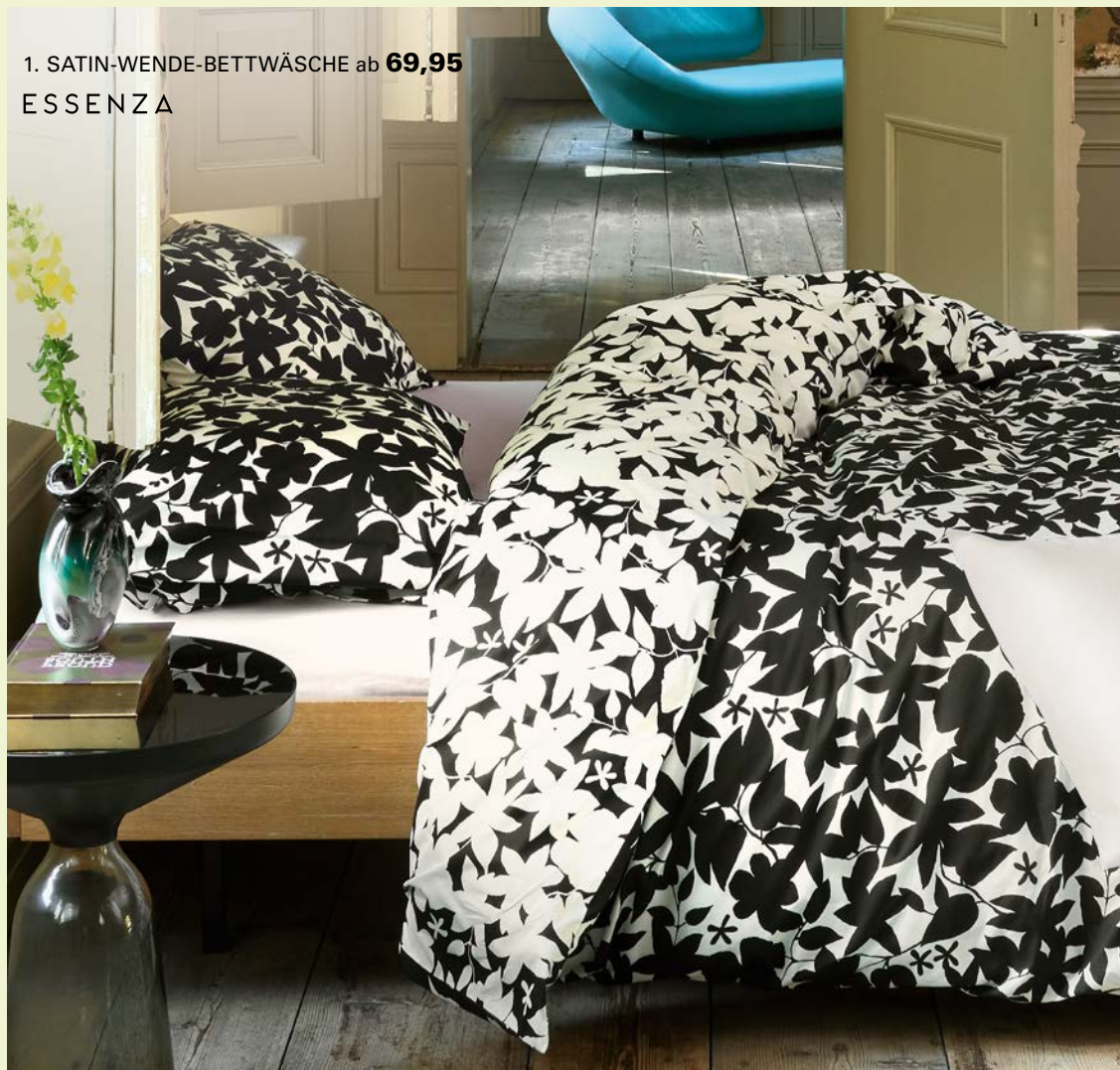
1. SATIN-WENDE-BETTWÄSCHE ab 69,95 ESSENZA