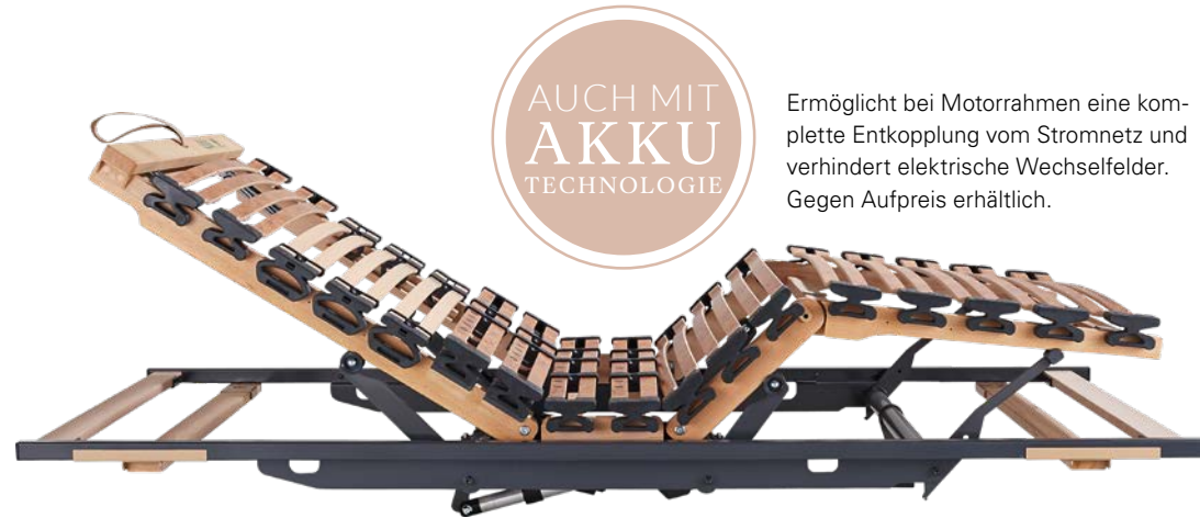
6. RAHMEN DORMABELL INNOVA M2 MEMORY 2.399,-